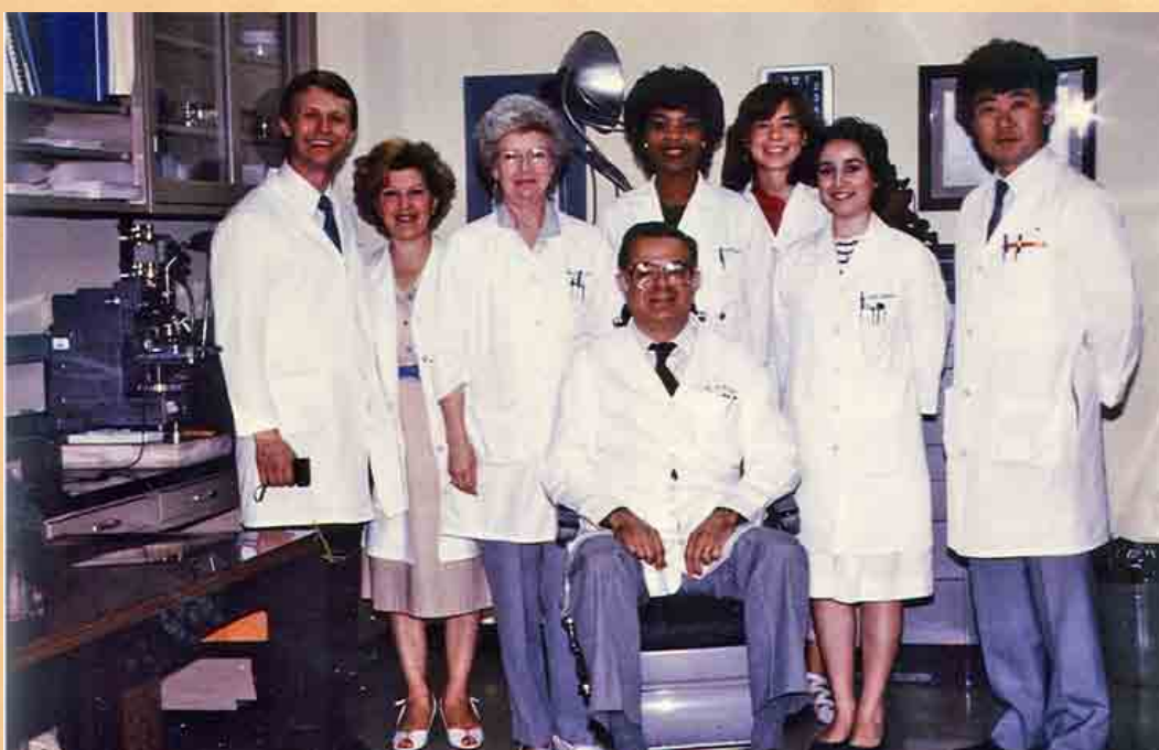
Με ομάδα συνεργατών του στο Πανεπιστήμιο Birmingham της Αλαμπάμα των Η.Π.Α.

Στο Πανεπιστήμιο της Αλαμπάμα, όπου έκανε στην συνέχεια μία λαμπρή ακαδημαϊκή σταδιοδρομία, ξεκίνησε αρχικά ως ειδικός σπουδαστής για την απόκτηση, μετά από διετή φοίτηση (1958-1960), του πτυχίου της Οδοντιατρικής Αμερικανικών Πανεπιστημίων (DMD). Στην συνέχεια πήρε την πρώτη του ακαδημαϊκή θέση ως Assistant Professor, το 1960, για ν' ανεβεί γρήγορα την κλίμακα της ακαδημαϊκής ιεραρχίας, ως Associate Professor το 1964 και Full Professor το 1969, θέση την οποία κατείχε μέχρι την αφυπηρέτησή του. Παράλληλα, κατείχε από το 1968 τον τίτλο και την θέση του Senior Scientist στο Institute of Dental Research, του ίδιου Πανεπιστημίου, Ίδρυμα το οποίο τίμησε και κόσμησε με την παρουσία του. Μετά από την αφυπηρέτησή του κατείχε τον τίτλο του Ομότιμου Καθηγητή μέχρι την αποδημία του το 2008.