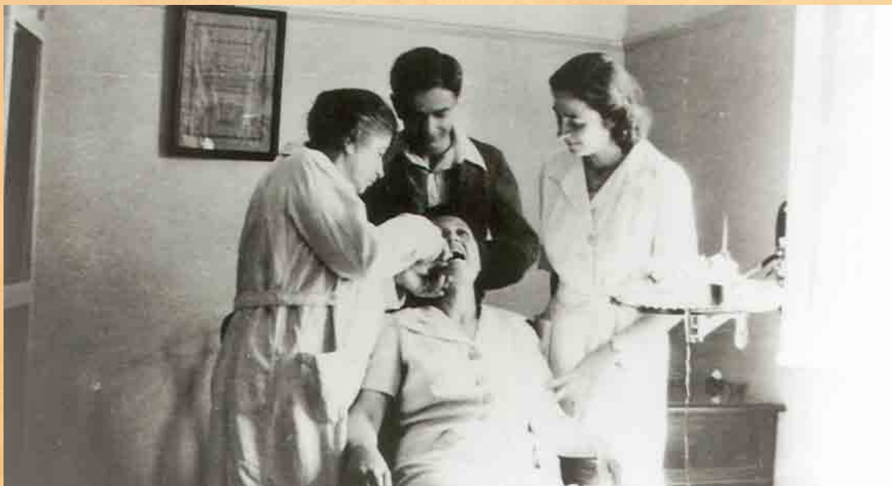
Τα πρώτα βήματα στην Οδοντιατρική στο οδοντιατρείο της μητέρας του.