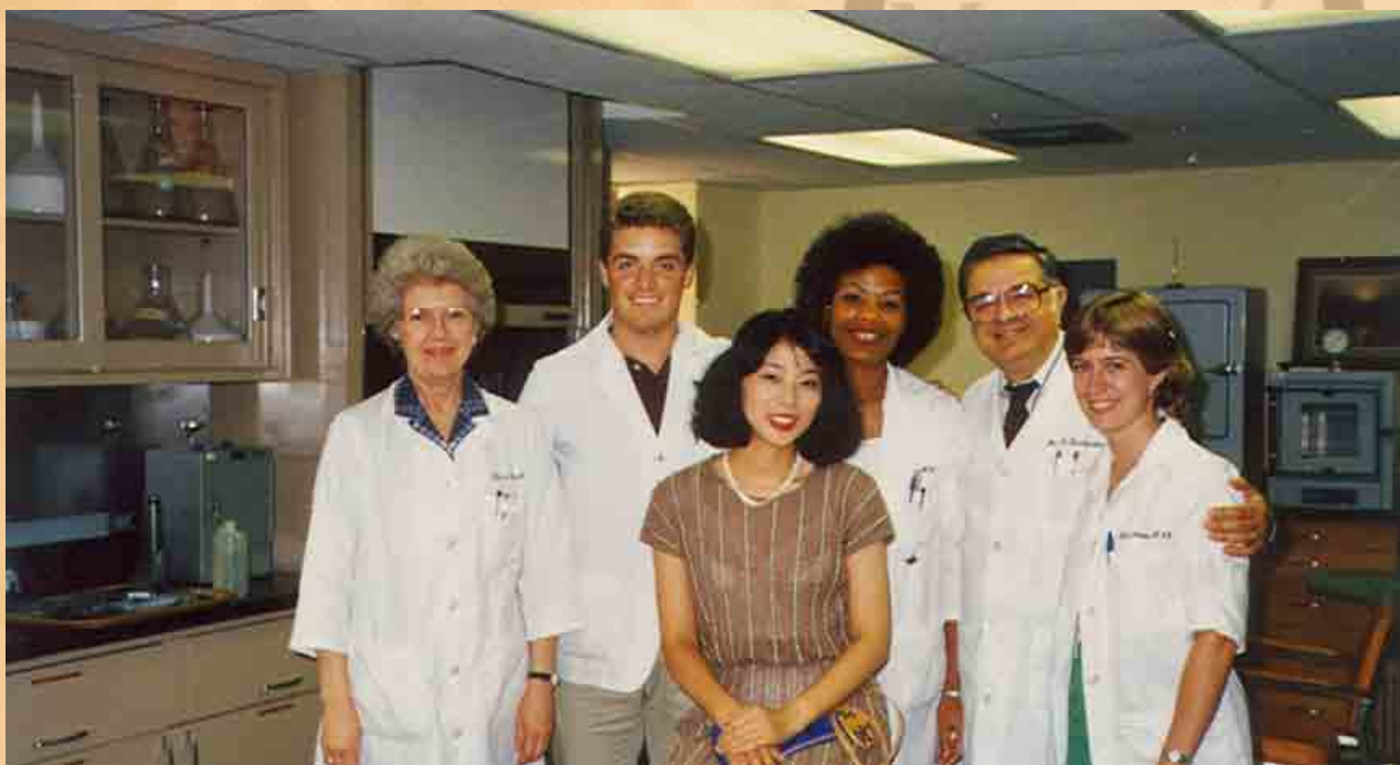
Με ομάδα συνεργατών του στο Πανεπιστήμιο Birmingham της Αλαμπάμα των Η.Π.Α.

Το επιστημονικό έργο του καθηγητή Θεόδωρου Κουλουρίδη ήταν πολύ σημαντικό και αφορά όλους τους τομείς της ακαδημαϊκής δραστηριότητας: έρευνα, διδασκαλία σε προπτυχιακό και μεταπτυχιακό επίπεδο και διοικητικά καθήκοντα.