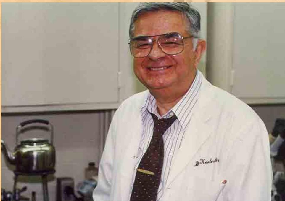
Στο Εργαστήριό του στο Πανεπιστήμιο Birmingham της Αλαμπάμα των Η.Π.Α.

Στο Πανεπιστήμιο της Αλαμπάμα, όπου έκανε στην συνέχεια μία λαμπρή ακαδημαϊκή σταδιοδρομία, ξεκίνησε αρχικά ως ειδικός σπουδαστής για την απόκτηση, μετά από διετή φοίτηση (1958-1960), του πτυχίου της Οδοντιατρικής Αμερικανικών Πανεπιστημίων (DMD). Στην συνέχεια πήρε την πρώτη του ακαδημαϊκή θέση ως Assistant Professor, το 1960, για ν' ανεβεί γρήγορα την κλίμακα της ακαδημαϊκής ιεραρχίας, ως Associate Professor το 1964 και Full Professor το 1969, θέση την οποία κατείχε μέχρι την αφυπηρέτησή του. Παράλληλα, κατείχε από το 1968 τον τίτλο και την θέση του Senior Scientist στο Institute of Dental Research, του ίδιου Πανεπιστημίου, Ίδρυμα το οποίο τίμησε και κόσμησε με την παρουσία του. Μετά από την αφυπηρέτησή του κατείχε τον τίτλο του Ομότιμου Καθηγητή μέχρι την αποδημία του το 2008.