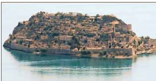
Εικόνα 4: Η νήσος Σπιναλόγκα.