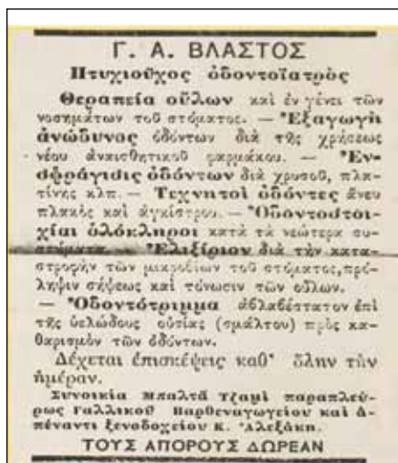
Εικόνα 2: Η ανακοίνωσή του Γ. Βλαστόύ στην εφημερίδα Ελευθερία (Ηρακλείο) της 10/4/1899.

Όσον δια την εξαγωγήν των ριζών και οδόντων και άλλα ασθενείαι, αι οποίαι συνεπάγονται εις την οδοντιατρικήν σπανίως παρουσιάζονται παρ ημίν, διότι οι έχοντες τοι-