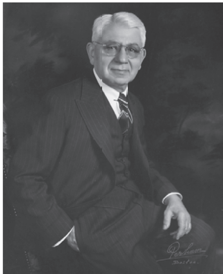
Εικ. 1. Ο διαπρεπής στοματικός, γναθοπροσωπικός και πλαστικός χειρουργός Varzstad H. Kazanjian το 1952. Fig. 1. The eminent oral, maxillofacial and plastic surgeon Dr. Varzstad H. Kazanjian in 1952.

Varzstad Kazanjian (Fig. 1) was born in Erzincan of the Turkish-occupied Armenia on March 18, 1879. He then moved to Samsun, Pontus, where he initially worked at the Post Office. To avoid the first Armenian genocide that