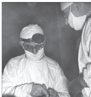
Εικ. 4. Ο Varaztad H. Kazanjian χειρουργώντας στην δεκαετία του 1940. Fig. 4. Dr. Varaztad H. Kazanjian operating, circa 1940's.