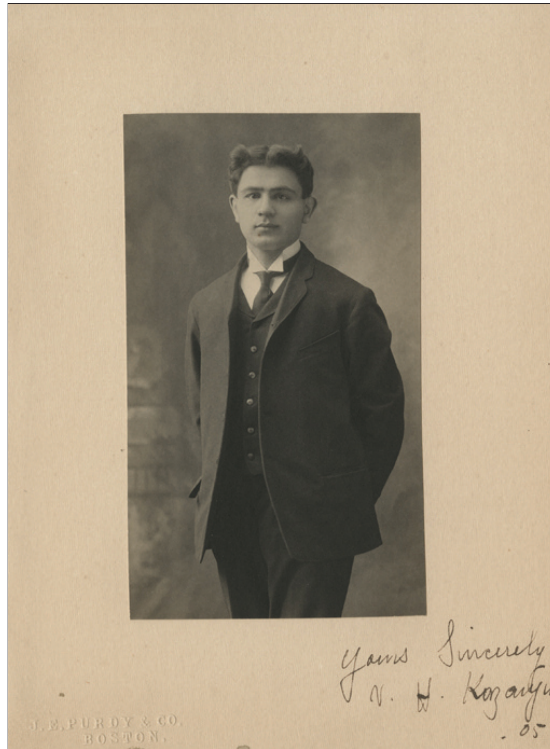
Εικ. 2. Ο Varzstad H. Kazanjian το 1905, κατά την αποφοίτησή του από την Οδοντιατρική Σχολή του Πανεπιστημίου Harvard.

Μία από τις μεγαλύτερες συνεισφορές του Kazanjian στην βιβλιογραφία της Πλαστικής Χειρουργικής, υπήρξε