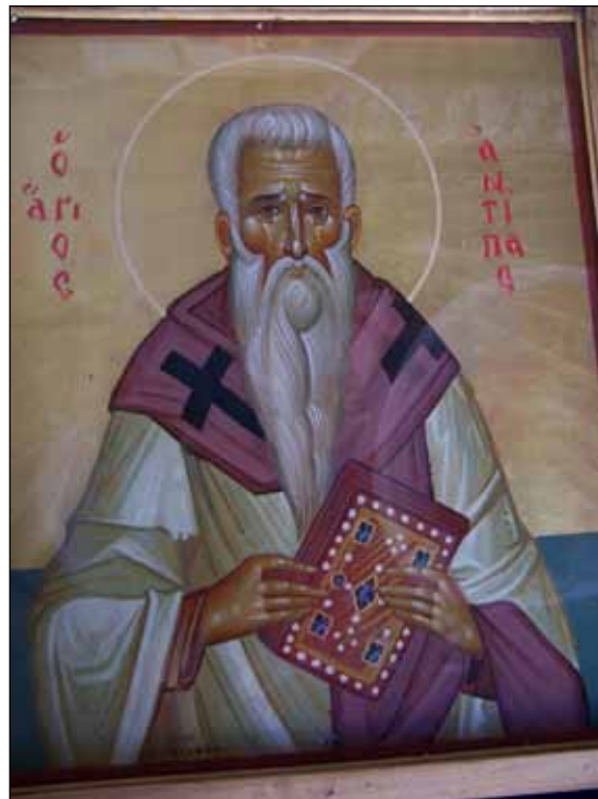
Εικόνα 5. Η Εικόνα του Αγίου Αντίπα στον Ιερό Πανεπιστημιακό Ναό.

Ο σκοπός του Ναού και η λειτουργία του καθορίζονται από τον Κανονισμό (αρ. 60) της Ιεράς Συνόδου της Εκκλησίας της Ελλάδος. «Περί ιδρύσεως και λειτουργίας του εν τω περιβόλω της Οδοντιατρικής Σχολής ανεγερθέντος Πανεπιστημιακού Ιερού Ναού» (περιοδ. εκκλησία , έτος ΝΓ', τευχ. Β', Φεβρουαρίου 1976). Κατά το άρθρο 1, ο Ναός «χρησιμεύει προς θεραπείαν των θρησκευτικών αναγκών των εν τω Πανεπιστημίω διδασκόντων και διδασκομένων και προς πρακτικήν εξάσκησιν φοιτητών της Θεολογικής Σχολής εν ταις εκ-