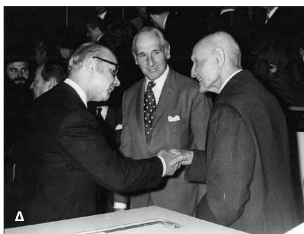
Εικόνα 6. Από την τελετή θεμελίωσης του Ιερού Ναού Ιωάννου του Προδρόμου, Ιωάννου του Θεολόγου και Αντίπα Περγάμου στο προαύλιο της Οδοντιατρικής Σχολής Πανεπιστημίου Αθηνών.