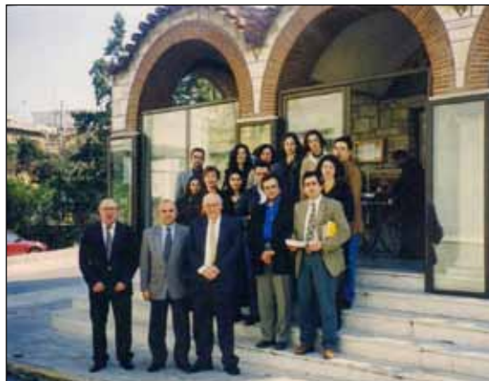
Εικόνα 8. Καθηγητές και φοιτητές ενώπιον του Ιερού Ναού Αγίου Αντίπα.

ξένων, και προσκηνυτών. Ήδη, το Φθινόπωρο του 1975 καθιερώθηκαν οι «συνάξεις της Πέμπτης» με θέματα θεολογικά, λειτουργικά και ιστορικά. Η προσπάθεια αυτή έχει διερευνηθεί με την ανάρτηση των ομιλιών και συζητήσεων στη θυρίδα «Άγιος Αντίπας» του Διαδυκτίου.