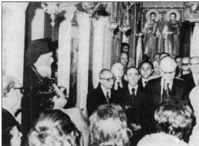
Εικόνα 7. Από την τελετή θυρανοξίων του Ναού.