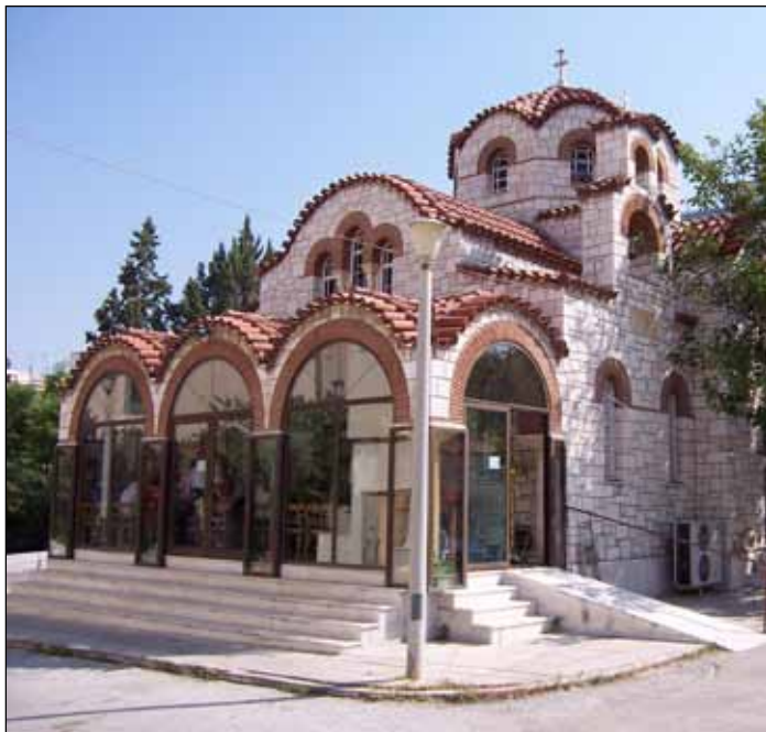
Εικόνα 4. Ο Ιερός Ναός του Αγίου Αντίπα στον περίβολο της Οδοντιατρικής Σχολής του Πανεπιστημίου Αθηνών (Γουδί).

Έλληνες φιλόσοφοι -θέμα σύνηθες στους ορθόδοξους Ναούς- «ως προειπόντες την έλευσιν του Χριστού» (Διονύσιος εκ Φουρνά). Ο Ναός τιμάται στο όνομα του Αγίου Προδρόμου, Αγίου Ιωάννου του Θεολόγου και Αγίου Αντίπα. Κατά τη δεκαετία του 1980 προστέθηκε από τον εφημέριο και τους Επιτρόπους, στους φερωνύμους Αγίους και ο Τυανέας ιατρός και μάρτυρας Ορέστης (+304), του οποίου το όνομα έφερε ο κτήτωρ.